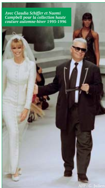
Avec Claudia Schiffer et Naomi Campbell pour la collection haute couture automne-hiver 1995-1996