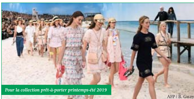
Pour la collection prêt-à-porter printemps-été 2019

PARIS Star planétaire de la haute couture, célèbre pour son allure mais aussi pour ses formules percutantes et controversées, Karl Lagerfeld est mort hier à l'âge de 85 ans. Le couturier a su réinventer avec brio la maison Chanel pendant plus de 30 ans tout en se forgeant son propre personnage.