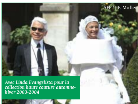
Avec Linda Evangelista pour la collection haute couture automne-hiver 2003-2004