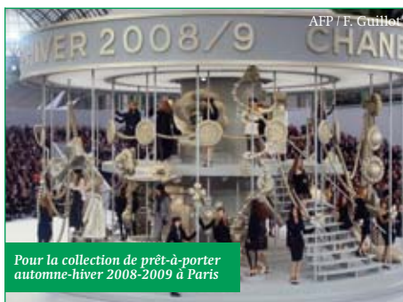
Pour la collection de prêt-à-porter automne-hiver 2008-2009 à Paris