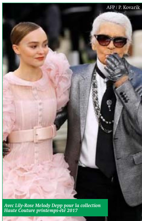
Avec Lily-Rose Melody Depp pour la collection Haute Couture printemps-été 2017